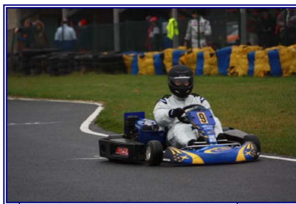
Sur le Subaru et sur une piste glissante !

« As-tu un film ou une série culte ? » Les Simpsons et Friends pour la série, pour le film je dirai : la vérité si je mens 2