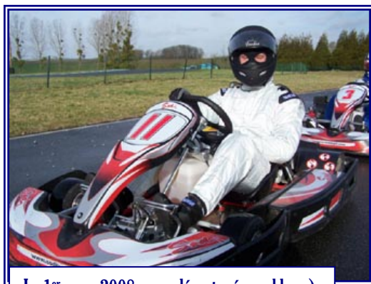
Le 1 er mars 2008... un départ mémorable ;-)

« Quel est ton rêve le plus fou ? » Comme tout le monde : gagner à l'Euromillions, ou un challenge Kart'air c'est pareil non ? Sinon une petite traversée du Canada en moto neige.