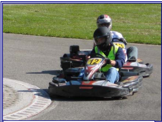
Meisenthal 2007 : une outrageuse domination et un second challenge alsacien remporté en 2 ans...