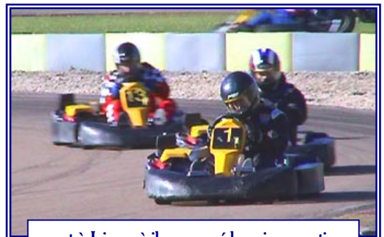
... et à Joigny où il aura mené la majeure partie de la seconde course !