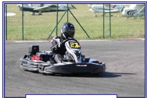
Sur sa piste fétiche du RKC !

« Quels sont tes objectifs pour 2009 ? » Finir dans le trio de tête du championnat interne AKL et améliorer mon meilleur résultat dans une course du challenge Kart'air.