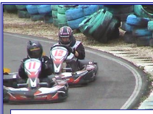
Grosse perf dans le challenge interne à Clotkart où il tient tête, un temps, à Ludo...