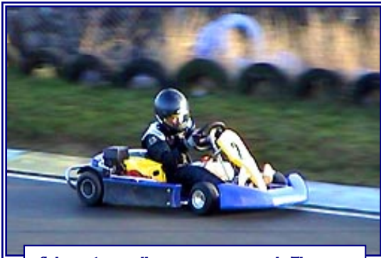
Cobra à Angerville, après sa victoire de Thiais...

« Et ton point faible en tant que pilote ? » Les pistes humides bien que je m'y améliore, une tendance à m'énerver un peu trop vite, et enfin je n'aime pas la pression de pilotes qui me suivent.